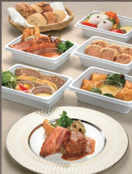
ビストロコース2名様分：お皿のお料理は盛付けのイメージです