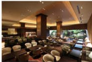
ロビーラウンジ「シャルール」