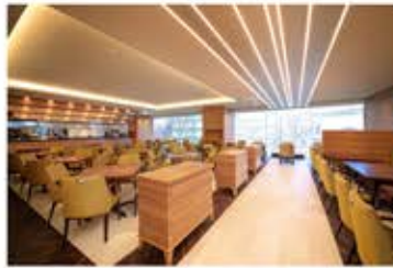
レストラン「セレニティ」