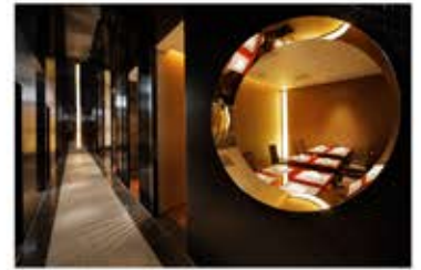
日本料理・鉄板焼「はや瀬」